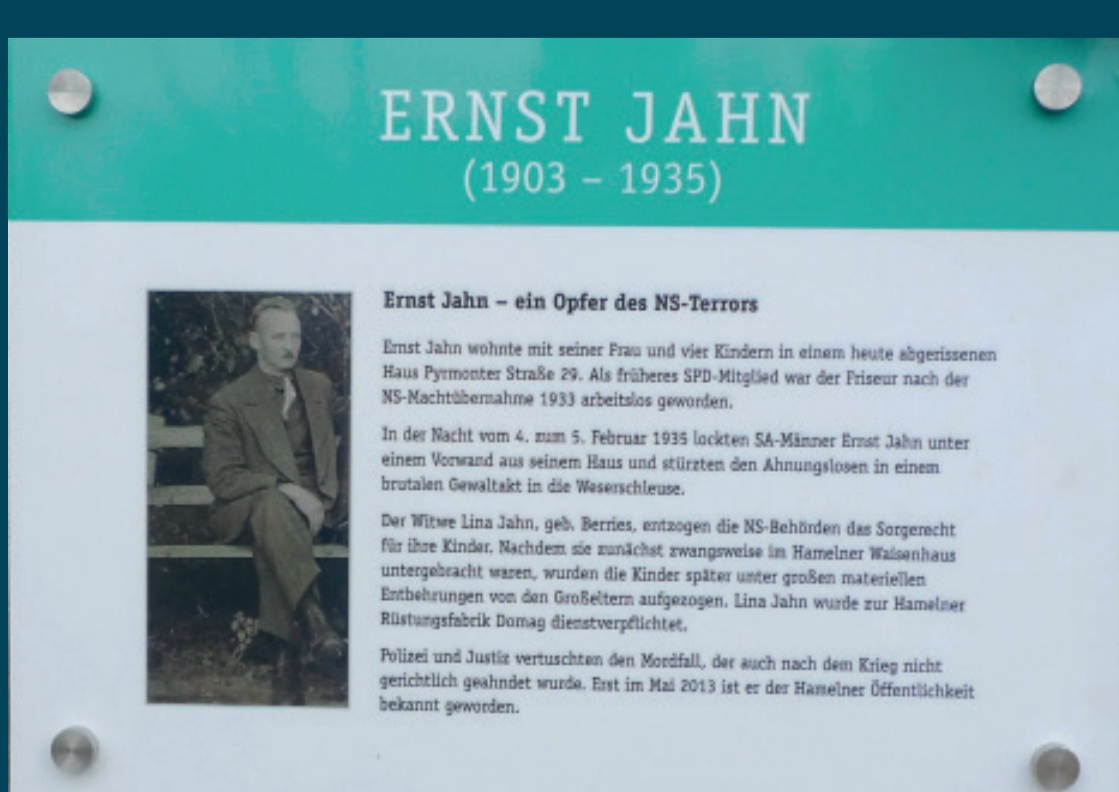
Stolperstein und Erinnerungstafel für Ernst Jahn an der Hamelner Schleuse Sammlung Gelderblom